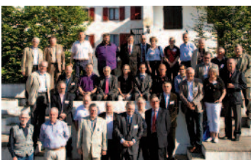
30 maires, députés, conseillers généraux et régionaux parmi le collège des Membres Propriétaires VVF Villages.

L'Assemblée Générale annuelle, tenue les 7 et 8 avril, a été l'occasion pour l'Association de faire le point sur les enjeux de son activité et de son secteur. L'ensemble des administrateurs et des