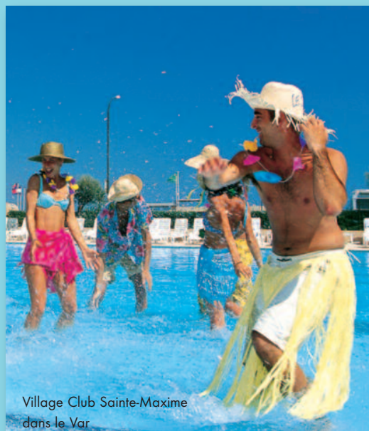
Village Club Sainte-Maxime dans le Var

Un seul mot d'ordre : s'imprégner des richesses du pays d'accueil ! En Village Club, les adultes pourront bénéficier de 2 à 3 animations par jour, d'1 journée entière d'animation, d'1 journée familiale et de rendez-vous spéciaux en fin d'après-midi et de soirées. Quant aux plus jeunes, ils profiteront d'aménagements pensés pour tous les âges : des jeux d'éveil pour les nourrissons, des jeux éducatifs pour les 3-6 ans et des activités sportives à partir de 7 ans, sans compter les soirées pour les adolescents entre 15 et 17 ans.